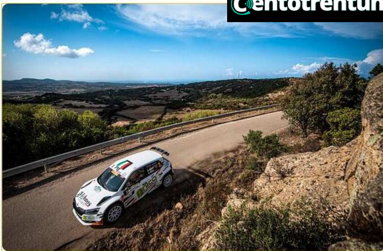
Diomedi-Turati, vincitori del 9° Rally Terra Sarda